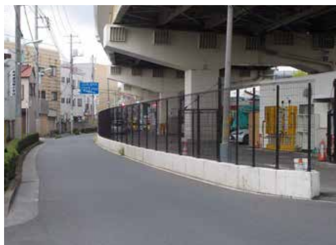
首都高速道路 補修基地 セキュリティ対策工事(フェンス更新)