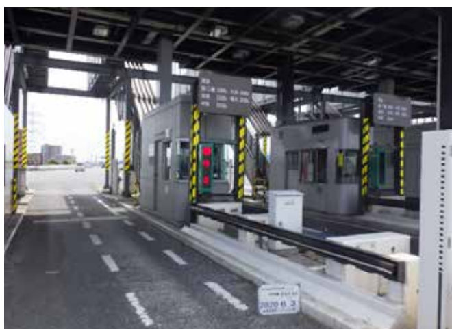
首都高速道路 料金所清掃