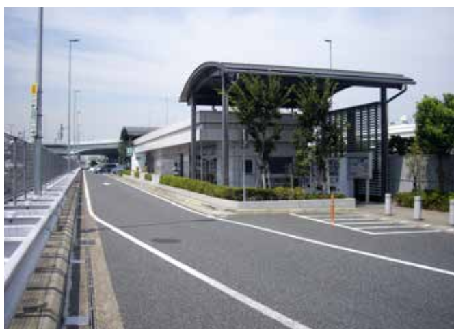
首都高速道路 PA維持管理(常駐清掃)