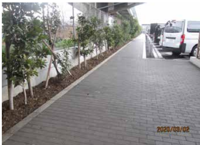
首都高速道路 PA植栽維持管理