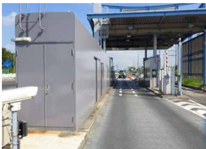
首都高速道路 料金所外装塗装