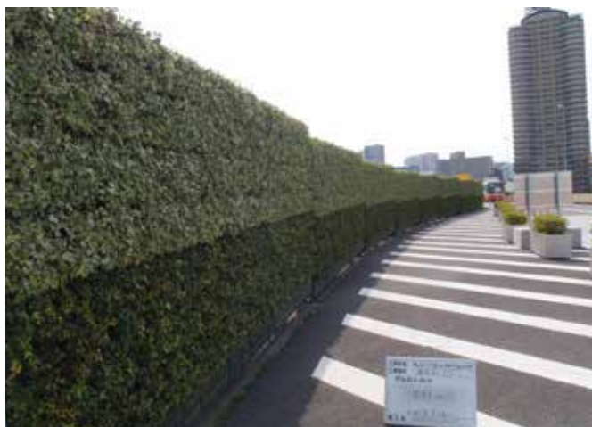
首都高速道路 PA壁面緑化維持